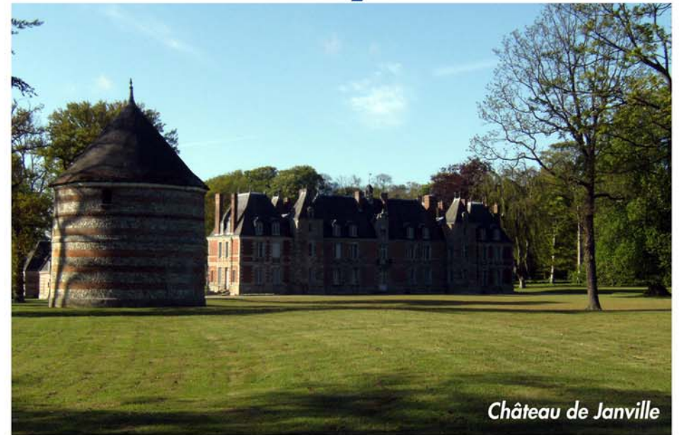
Château de Janville

Parcours 50 km - Parcours 80 km - Parcours 135 km V.T.T Suivre le flèche jaune